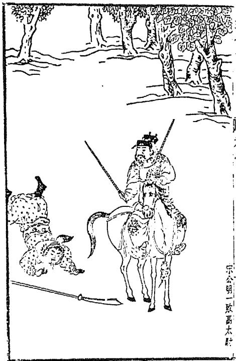
宗公明一敗高太尉