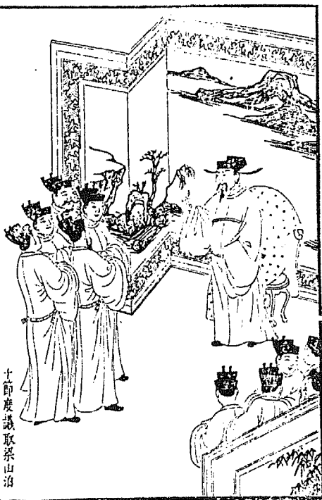
士節度議取梁山泊